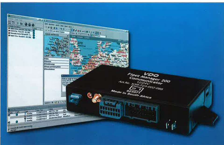
Fleet Manager 200 Communicator – zintegrowany z modemem GSM (GPRS) oraz odbiornikiem GPS (śledzenie pojazdu on-line)