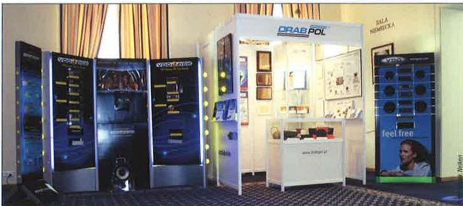
Stoisko DRABPOL-u na Wystawie Firm Sukcesu

zentacji naszych produktów. Szczególnie ta, dotycząca sprzętu car audio, systemów nawigacyjnych i multimedialnych wzbudzała największe zainteresowanie. Uroczystość wręczenia nagród - Statuetek Lidera Polskiego Biznesu odbędzie się podczas Wielkiej Gali Liderów Polskiego Biznesu 17 stycznia 2004 roku w Teatrze Wielkim w Warszawie. Trzymamy kciuki za naszą firmę.