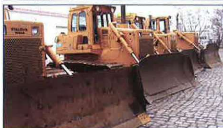
W tym parku maszynowym użytkowane są systemy zarządzania flotą pojazdów /maszyn FM 200 wraz z systemami pomiaru zużycia paliwa EDM 1404